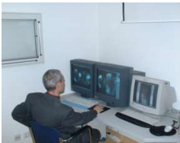
Funktionsprüfung durch Geschäftsführer der VEPRO East