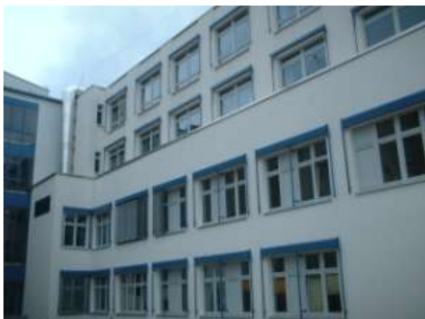
Ansicht vom KH Döbeln