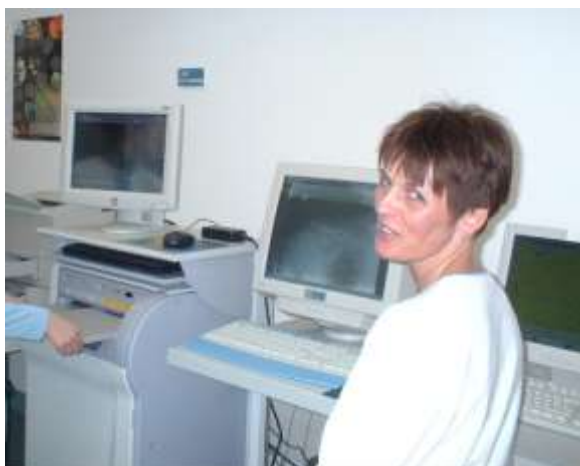
MTRA begrüßt die neue Anlage (2002)