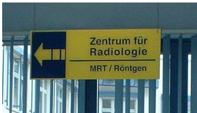
Weg zur Radiologie