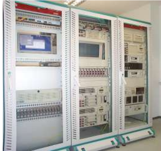
Archive database 2TB Server and Web-Server