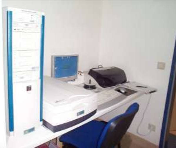
DVD/CD robot and Scanner station