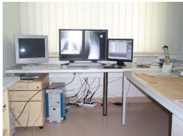
Installation Diagnosis Station