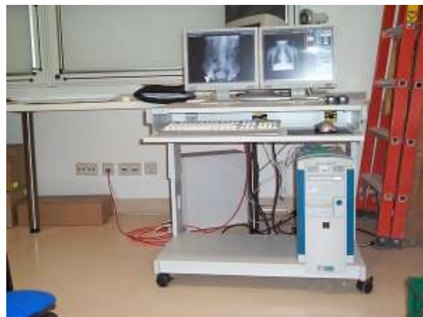
Installation: Conference Room