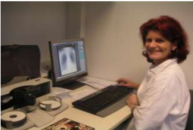
MTRA bei der Arbeit am CD-/DVD-Roboter