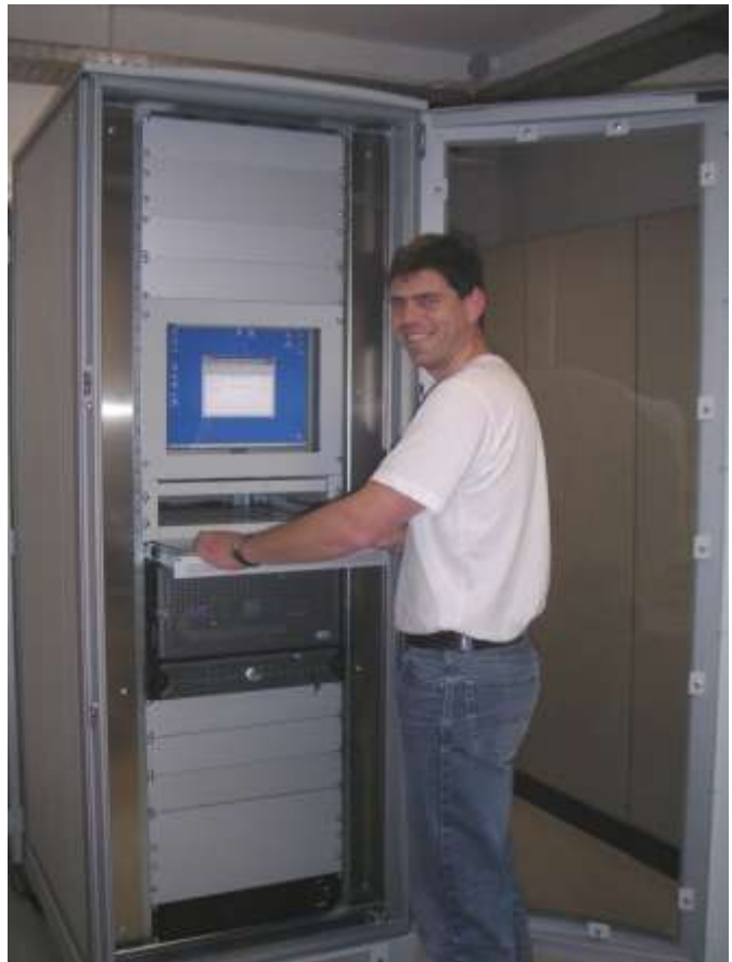
Mitarbeiter der DV-Abteilung bei Kontrolle am PACS-Server