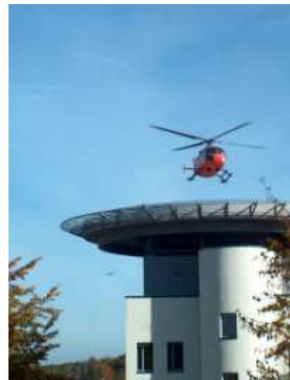
Außenansicht des KKH Belzig mit Hubschrauberlandeplatz über der Notaufnahme