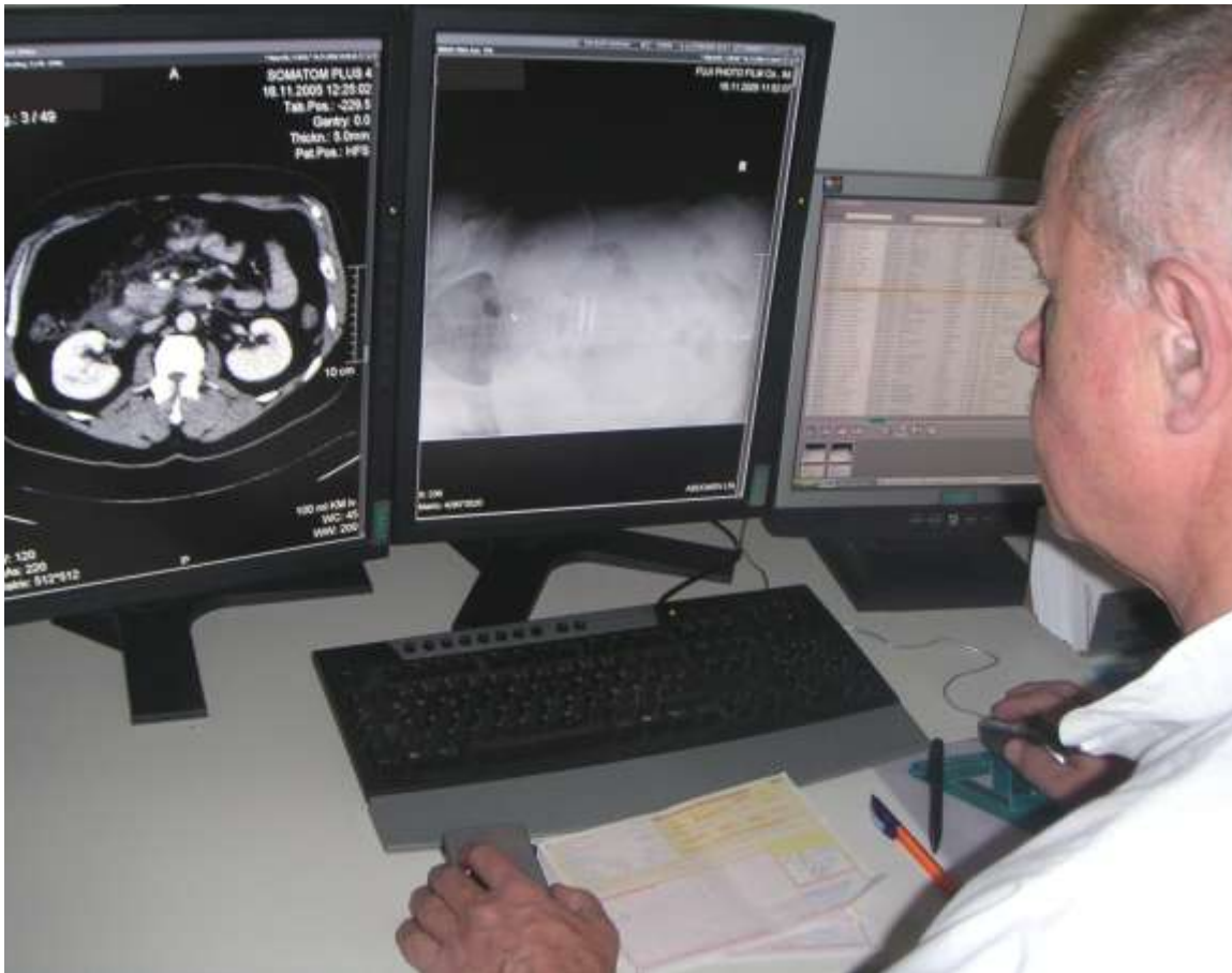
logie beim Befunden an einer hochauflösenden Doppelmonitor-Station