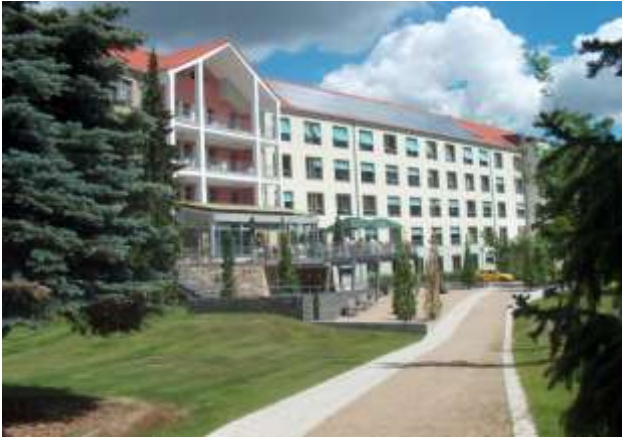
Außenansicht Kreiskrankenhaus Belzig