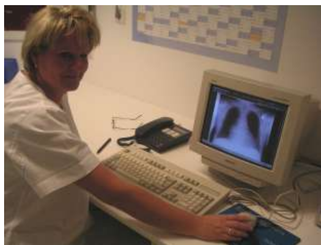
Auch an WEB- Arbeitsplätzen stehen alle Bilder als DICOM- Datensatz in Sekundenschnelle zur Verfügung