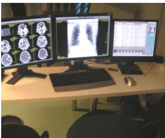
inierter Arbeitsplatz für Filmbesprechung u. Notaufnahme