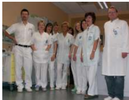
Das Team der niedergel. RadGP