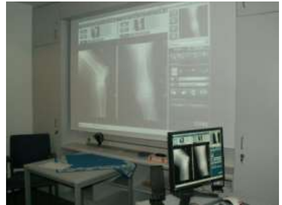
Demonstration über VEPRO-WEB-Lösung