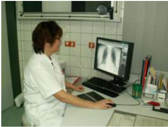
Single-Monitor-Befund-WS in der Notfallambulanz mit vollem ONLINE-Archivzugriff