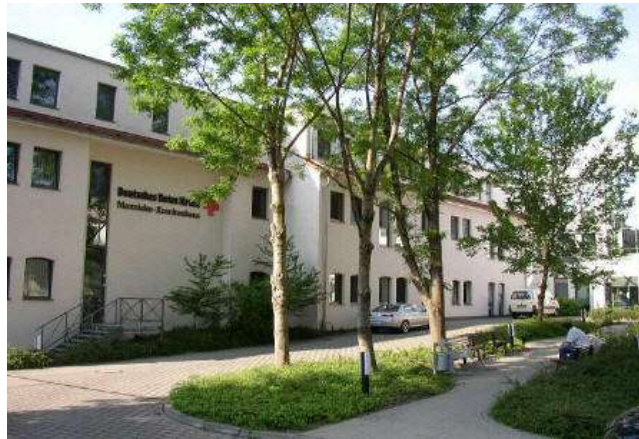
DRK – Manniske – Krankenhaus