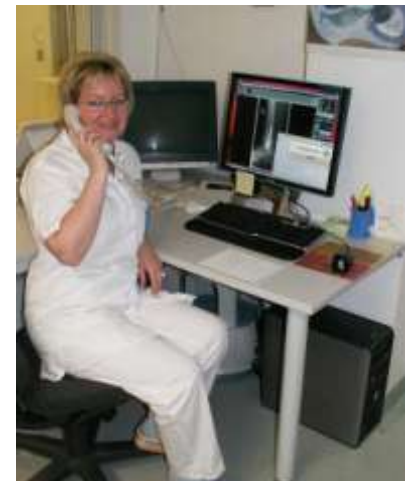
MTRA-WS mit RIS-Integration