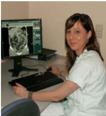
MTRA-WS zur Nachbearbeitung